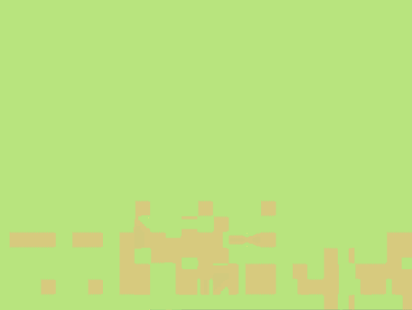
图 3-1-1 柜体